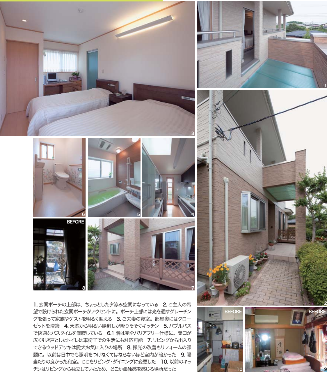
1. 玄関ポーチの上部は、ちょっとした夕涼み空間になっている 2. ご主人の希望で設けられた玄関ポーチがアクセントに。ポーチ上部には光を通すグレーチングを張って家族やゲストを明るく迎える 3. ご夫妻の寝室。部屋奥にはクローゼットを増築 4. 天窓から明るい陽射しが降りそそぐキッチン 5. パルパバスで快適なバスタイムを満喫している 6.1階は完全バリアフリー仕様に。間口が広く引き戸としたトイレは車椅子での生活にも対応可能 7. リビングから出入りできるウッドデッキは愛犬お気に入りの場所 8. 採光の改善もリフォームの課題に。以前は日中でも照明をつけなくてはならないほど室内が暗かった 9. 陽当たりの良かった和室。ここをリビング・ダイニングに変更した 10. 以前のキッチンがリビングから独立していたため、どこか孤独感を感じる場所だった

10年、20年先を見据えた、何物にも換えがたい快適さや安心感をもたらしけるリフォームの好例といえるでしょう。