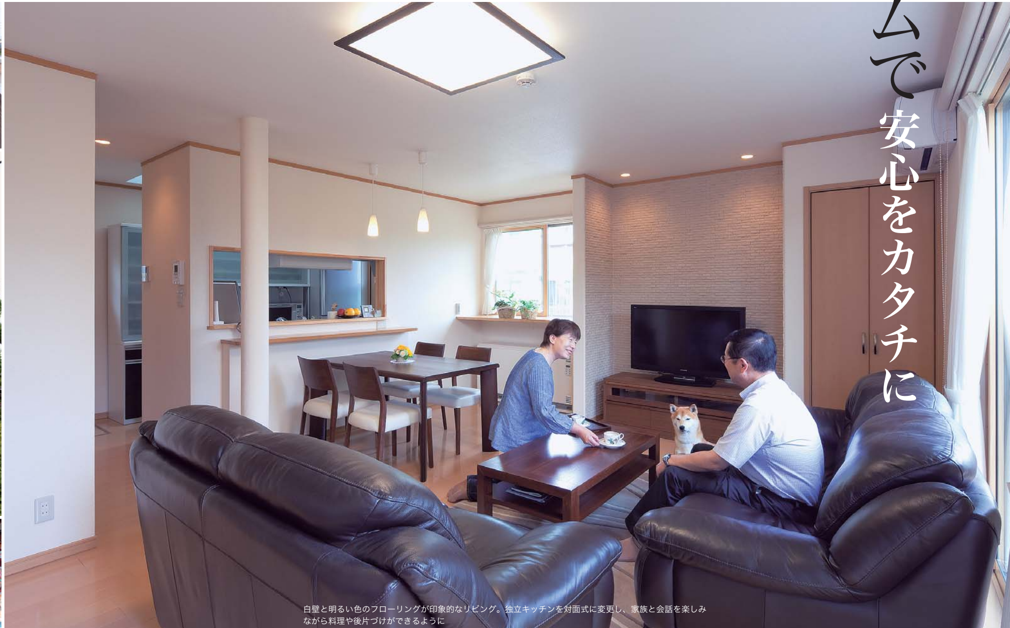
白壁と明るい色のフローリングが印象的なリビング。独立キッチンが対面式に変更し、家族と会話を楽しみながら料理や後片づけができるように